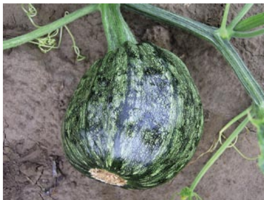
Slika 2. ZYMV: bradavičavost ploda

kao i različite deformacije liske. Razvijeni plodovi zaraženih biljaka bili su deformisani, često sa karakterističnim bradavičastim izraštajima na površini (Slika 2). Simptomi uočeni u toku 2008. godine bili su takođe raznovrsni – od blagog mozaika, hloroze i šarenila lista do izraženog žutozelenog mozaika, izobličavanja lista, duboke nazubljenosti (Slika 3), sve do potpune redukcije lisne površine, odnosno nitavosti. Na stablu pojedinih vreža često je uočavano hlorotično prošaravanje (Slika 4). Pojedine biljke ispoljile su virusne simptome samo na određenim delovima vreža ili samo na mlađem lišću. Kao česta pojava uočeno je žutilo i sušenje starijeg lišća. Usled očigledne rane zaraze biljke su bile zakržljale, bez zametnutih plodova ili sa intenzivnim simptomima na plodu u vidu izraženih deformacija (Slika 4) ili nekroze tek formiranih plodova.