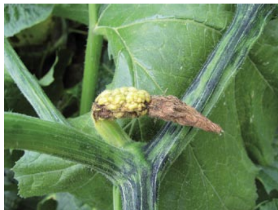
Slika 4. Mešana infekcija ZYMV i CMV: izražena kvrgavost i veoma deformisan mladi plod i šarenilo stabla