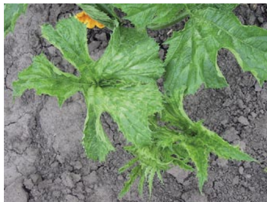
Slika 3. ZYMV: mozaik, nazubljenost i smanjena površina lišća

kao i različite deformacije liske. Razvijeni plodovi zaraženih biljaka bili su deformisani, često sa karakterističnim bradavičastim izraštajima na površini (Slika 2). Simptomi uočeni u toku 2008. godine bili su takođe raznovrsni – od blagog mozaika, hloroze i šarenila lista do izraženog žutozelenog mozaika, izobličavanja lista, duboke nazubljenosti (Slika 3), sve do potpune redukcije lisne površine, odnosno nitavosti. Na stablu pojedinih vreža često je uočavano hlorotično prošaravanje (Slika 4). Pojedine biljke ispoljile su virusne simptome samo na određenim delovima vreža ili samo na mlađem lišću. Kao česta pojava uočeno je žutilo i sušenje starijeg lišća. Usled očigledne rane zaraze biljke su bile zakržljale, bez zametnutih plodova ili sa intenzivnim simptomima na plodu u vidu izraženih deformacija (Slika 4) ili nekroze tek formiranih plodova.