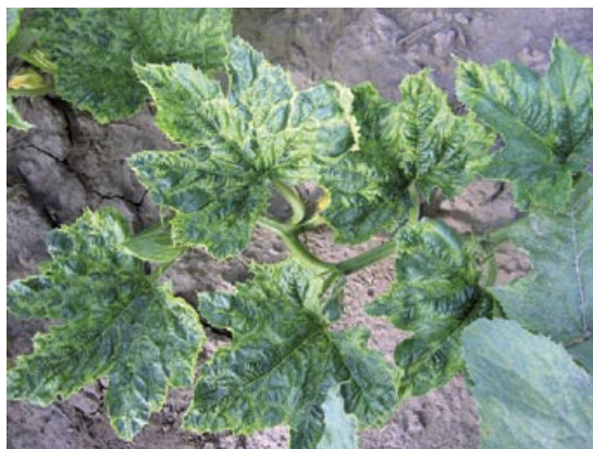
Slika 1. Mešana infekcija ZYMV, WMV i CMV: izraženi mozaik i naboranost lišća

U toku 2007. godine, procenjena zaraženost pregledanih useva kretala se od 30 do 50%, dok je procenjeni nivo učestalosti zaraze virusima 2008. godine bio znatno viši, preko 80%, a u pojedinim usevima sve biljke su ispoljile virusne simptome. Tokom pregleda u obe godine ispitivanja zabeležena je pojava niza simptoma koji su upućivali na virusnu zarazu. Tokom 2007. godine uočeni su simptomi u vidu blagog mozaika i hlorotičnog šarenila, izraženog mozaika i naboranosti (Slika 1),