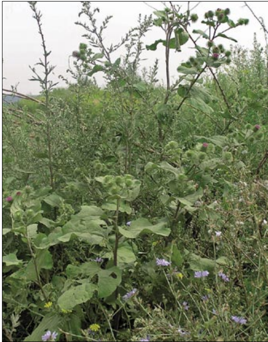
Slika 3. Detalj zajednice Arctio-Artemisietum vulgaris

Areal zajednice Arctio-Artemisietum vulgaris uglavnom obuhvata zemlje zapadne i srednje Evrope, a naša zemlja se nalazi na jugoistočnoj granici njenog areala. Inače, ovu asocijaciju je opisao veći broj evropskih istraživača pod drugim nazivima koji se danas smatraju sinonimima: Tanaceto-Artrmisietum arctietosum ili Tanaceto-Artemisietum typicum (Zajac, 1974; Šegulja, 1976; Hejny i sar., 1979).