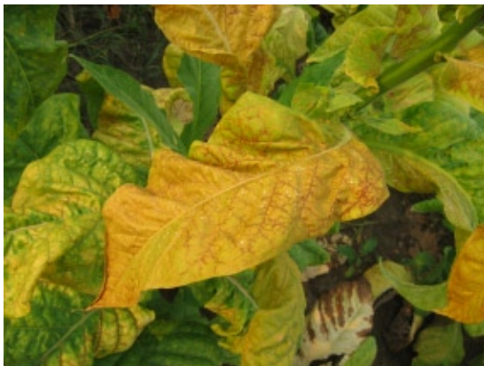
Slika 2. Smedecrvenkasta (bakarna) obojenost lista duvana Figure 2. Tobacco leaf reddish-brown (copper) color

vidu promene opšteg izgleda biljaka, tako i u hromatskim i morfološkim promenama lišća duvana. Najčešće uočeni simptom na lišću duvana bio je prosvetljavanje nerava, praćen nekrozom koja se širila i zahvatala celu površinu liski (Slika 1). Sa razvojem bolesti dolazi do spajanja nekrotičnih površina i ceo list poprima smeđecrvenkastu boju (Slika 2). Zaraženo, naročito donje lišće propada pre vremena, tako da se samo na vrhu stabla zadržavaju buketići sitnih listića. Na zaraženim biljkama javlja se i nekroza stabla, lisnih drški, čašičnih i kruničnih listića (Slika 3). Takođe, primećena je i pojava zaostajanja biljaka u porastu i izražene kržljivosti.