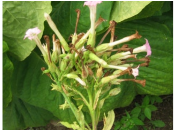
Slika 3. Nekroza cvetnih delova Figure 3. Necrosis of flower parts

Ispitivanjem prisustva i rasprostranjenosti virusa duvana, u sedam lokaliteta, tokom 2006. godine, utvrđe-