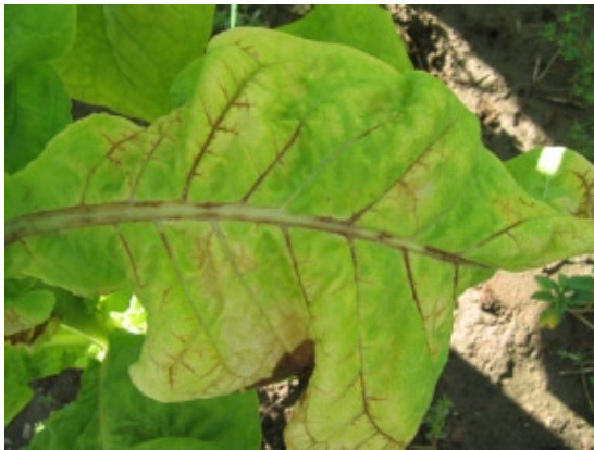
Slika 1. Nekroza nerava na lišću duvana Figure 1. Tobacco leaf vein necrosis